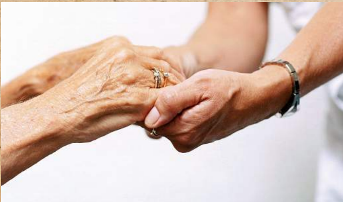
Assistenza agli anziani in condizioni economiche disagiate, anche attraverso la gestione di strutture di accoglienza.