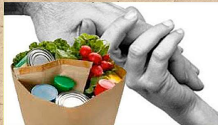
Istituzione di "Banchi Alimentari" per la distribuzione di prodotti alimentari alle persone e famiglie indigenti, durante le giornate a loro dedicate.